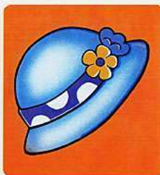
yī dǐng mào zi 一顶帽子 a cup