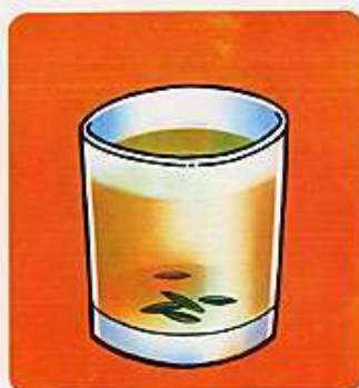
yī bēi chá 一杯茶 a cup of tea

来了五只小猴子， 买走一张小桌子， 两把小椅子， 三双小袜子， 四个小瓶子， 五顶小帽子。